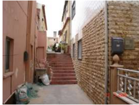
Travessa dos Falcões