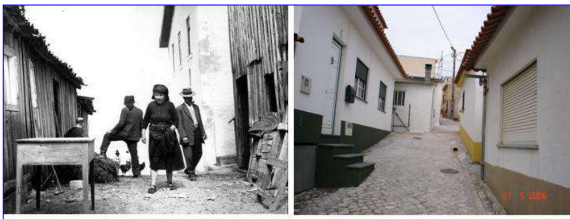
Travessa do Areal