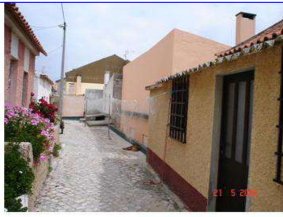
Beco dos Teimosos