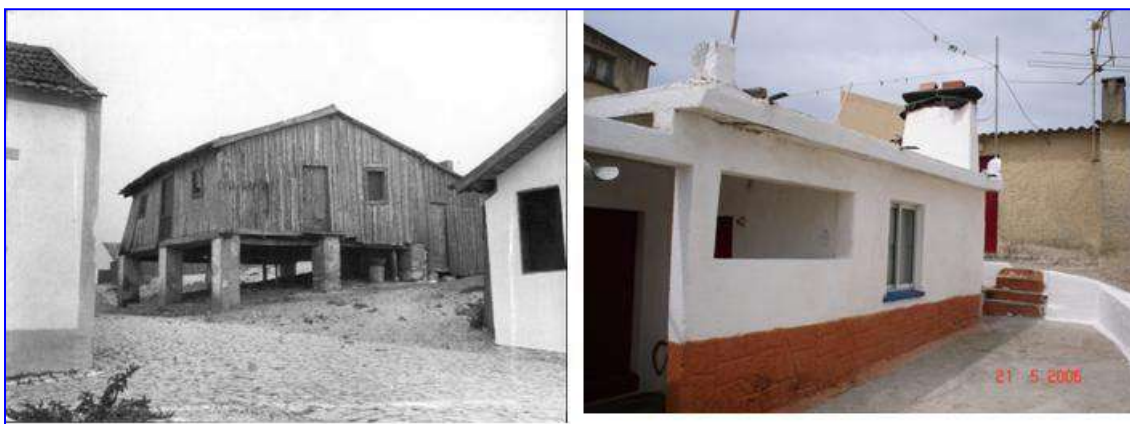
Beco dos Teimosos