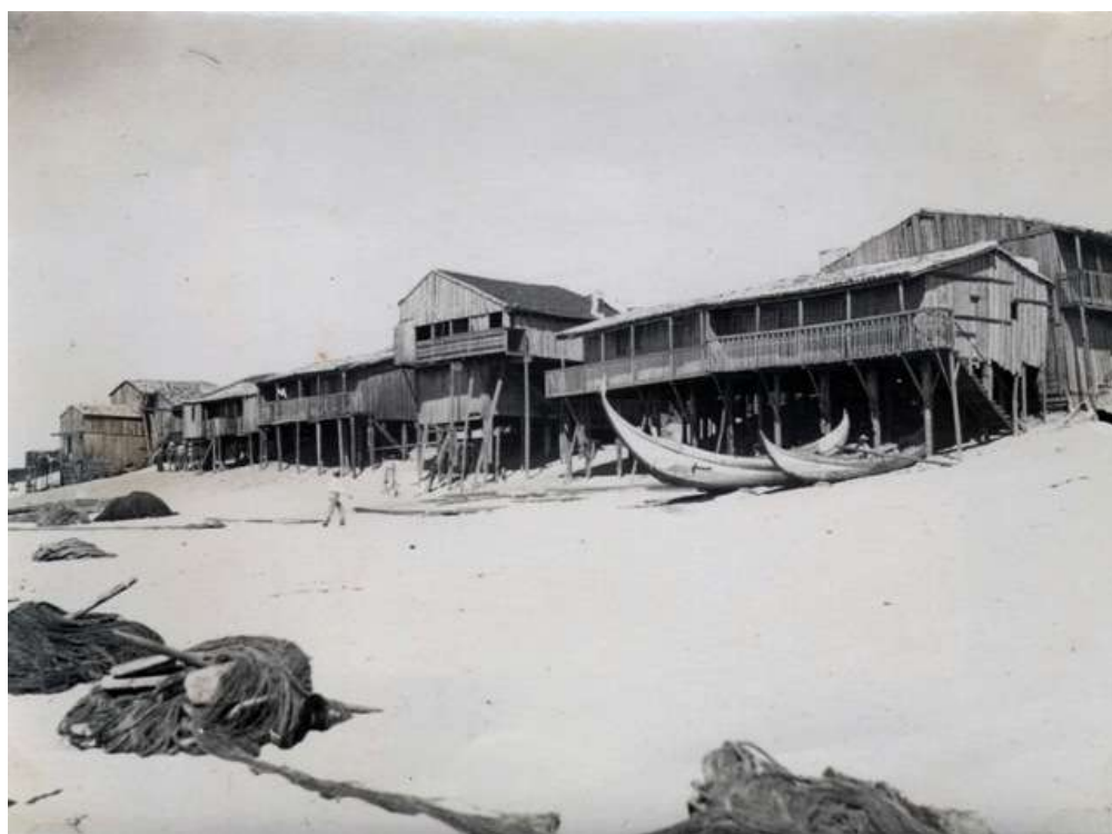
Palheiros na Praia de Vieira de Leiria, com barcos meia-lua

Vice-Presidente da Câmara Municipal da Marinha Grande