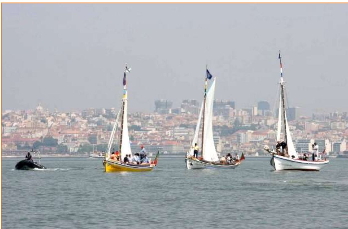
Canoas "Ana Paula" e "Salvaram-me", da Moita, e canoa "Ponta da Marinha" de Sarilhos Pequenos, no Desfile do Dia da Marinha do Tejo , entre a Doca da Marinha e a Base Naval do Alfeite