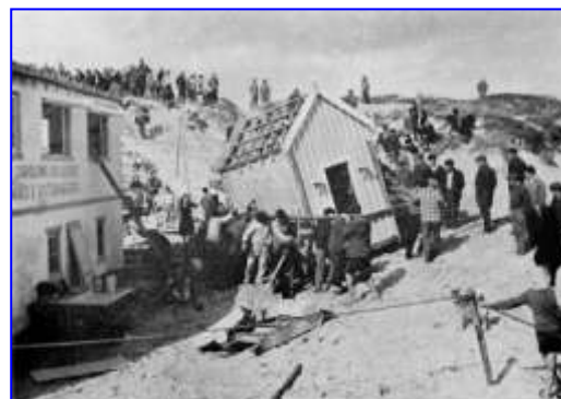
Fig. 70 — Caparica. Mudança de uma pequena casa de madeira, fugindo às marés. Inverno de 1963 (cliché de Filmarte).

Fig. 70 (do livro) – Caparica. Mudança de uma pequena casa de madeira, fugindo às marés. Inverno de 1963. (Cliché de Filmarte).