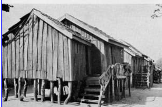
Fig. 68 — Cancieira. Barracas.