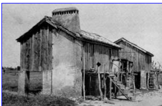
Fig. 66 — Palhota. Barracas. Notar a chaminé de tijolo, que vem até ao solo.

Estes agrupamentos de barracas são raros, e formam aldeiazinhas muito limpas. Os interiores são arrumados, asseados, torrados com papéis vistosos e panos garridos (fig. 67). Das paredes das casas saem ramos grossos de oliveiras (fig. 69), pois os troncos dessas árvores foram aproveitados como prumos que oferecem maior firmeza. Nos terreiros a lenha amontoa-se sobre estacas, e os galinheiros e pocilgas são palatíticos como as casas.