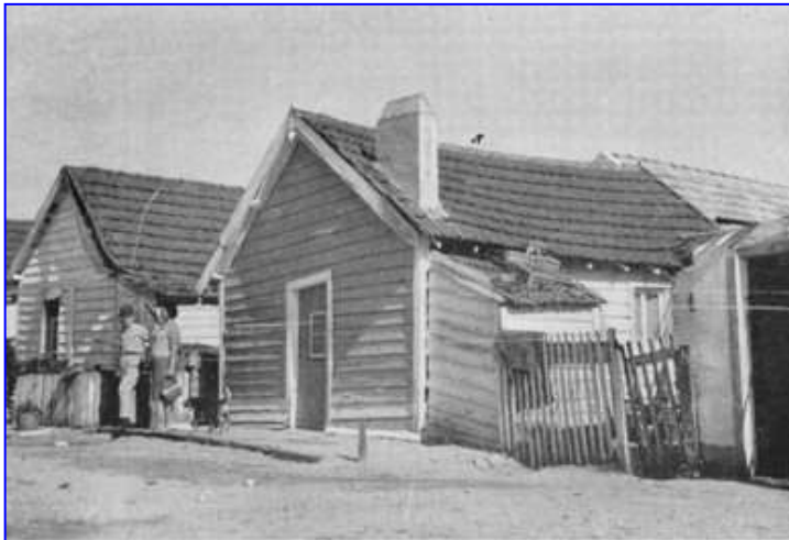
Fig. 61 — Caparica, Barracas.