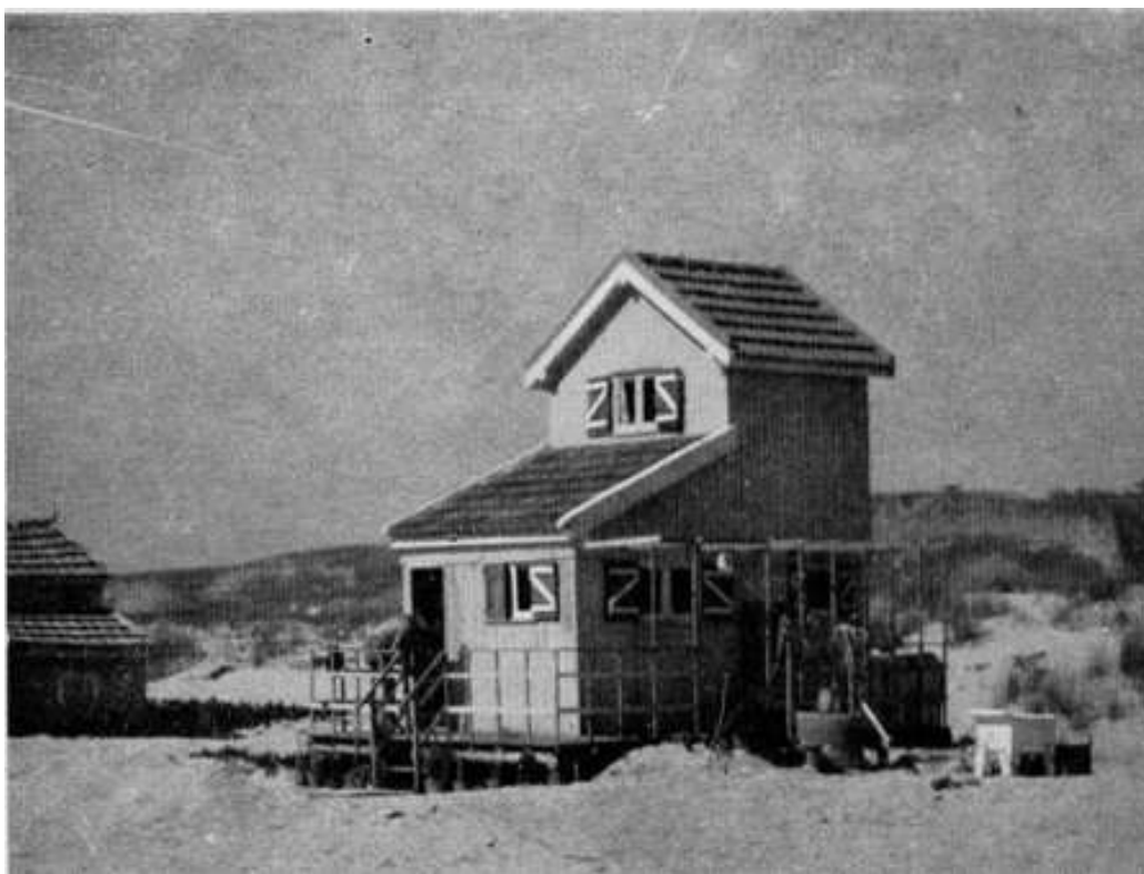
Fig. 63 - Caparica. Barraca de veraneantes. (do livro)