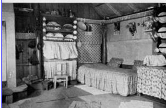
Fig. 67 — Palhota. Barraca. Interior.