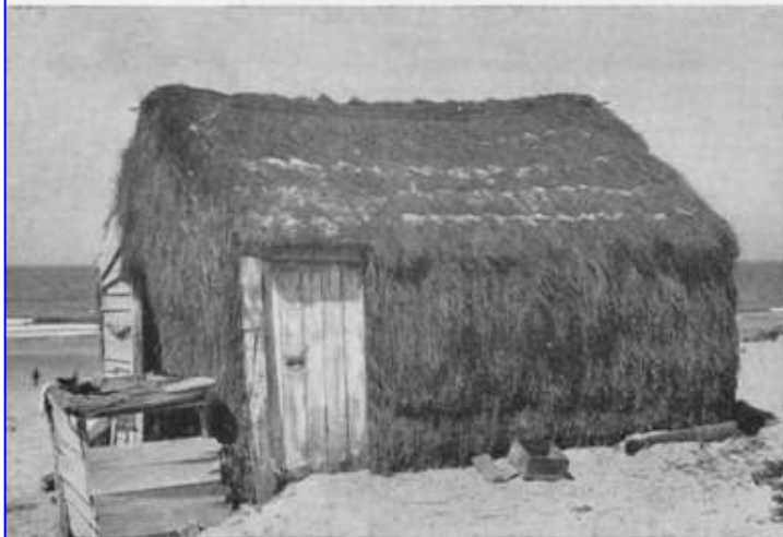
Fig. 62 — Fonte da Telha. Barraca de estorno.

A tradição da construção em madeira, e a falta de outro material local de construção, deu lugar, nos areais a sul da foz do Tejo, ao aparecimento de um género de pequeníssimas habitações de veraneio, sem quaisquer características particulares, e nas quais a fantasia do proprietário se manifesta por vezes de maneira exuberante. Constituindo, até ao desaparecimento da língua de areia que se prolongava em direcção ao Bugio, o casario da Cova do Vapor , algumas delas foram levadas para sul da Caparica, e prolongam hoje esta povoação com uma linha de cerca de dois quilómetros de casinhas variadas. Erguidas sobre estacas, ou no sistema de pau a pique, térreas ou de andar, com torres góticas ou janelas mouriscas, simpáticas na sua modéstia ou pretensão, elas apenas interessam a este estudo porque parecem representar um prolongamento da anterior construção em madeira (fig. 63). [sublinhado nosso]