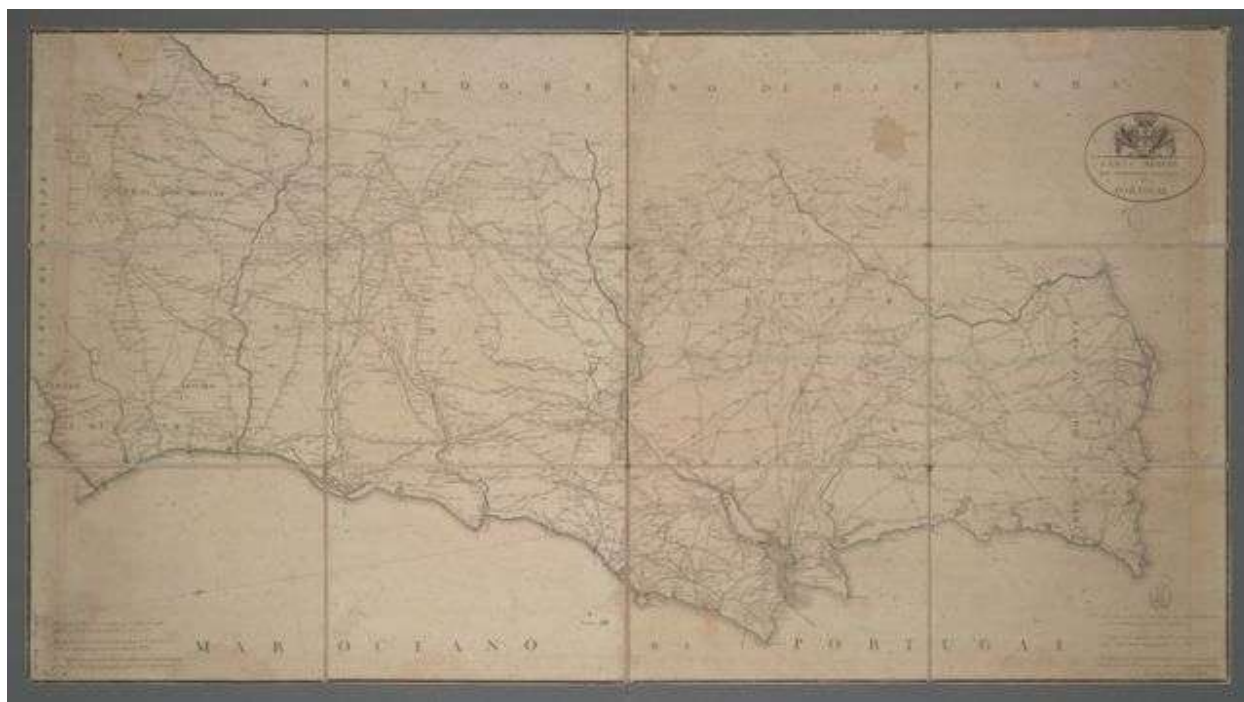
1808: Vieira de Leiria inscrevia-se no mapa como "Avieira"

pesca com os chinchorros, artes referenciadas nas memórias paroquiais de 1758 da freguesia de Quaios.