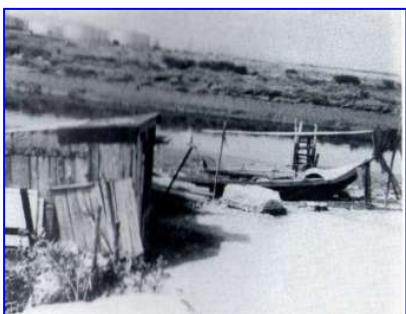
22. SACAVÉM. Barco avieiro, estendal de redes e barraco para aprestos (1974)

FONTE DO TEXTO: Boletim Cultural Nº 92, 2º Tomo, Assembleia Distrital de Lisboa. 1990/1998.