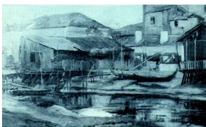
19. DOCA DE SCAVÉM. Casas avieiras. Óleo de Frederico Aires (1925).