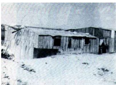
20. SACAVÉM. Casas Avieiras (1974)