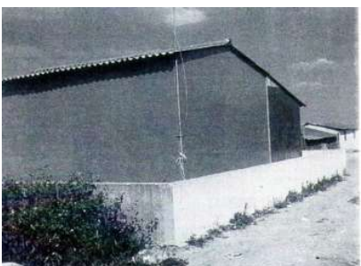
21. SACAVÉM. Casa Avieira (1982)