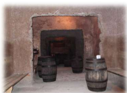
Aspetto do lagar de vinho, das alfaías antigas, dos tonéis e do seu aproveitamento, em espaços rústicos de convívio

Estes dois projetos complementares, que integram a Rota Turística e Cultural dos Avieiros, bem como do projecto de candidatura da Cultura Avieira a Património Imaterial Nacional e da UNESCO, são indispensáveis para a sua concretização e sucesso e constituem mais um passo na estruturação e consolidação da Rota que se pretende continuar a construir.