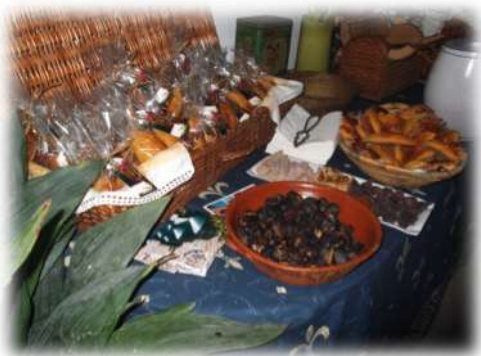
Em terras de “S. Martinho”, nada melhor que um convívio salutar com uma mão cheia de castanhas assadas e um antiquíssimo “abafado” da região...

Estes dois projetos complementares, que integram a Rota Turística e Cultural dos Avieiros, bem como do projecto de candidatura da Cultura Avieira a Património Imaterial Nacional e da UNESCO, são indispensáveis para a sua concretização e sucesso e constituem mais um passo na estruturação e consolidação da Rota que se pretende continuar a construir.