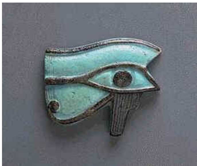
Ilustração 1 - O olho-udjat como amuleto de turquesa e faiança negra.

Creio que se justifica, de facto, a tese da origem egípcia para o «olho» das embarcações, embora nem sempre seja fácil traçar o percurso ao longo dos tempos de tal símbolo-signo. Ele existe, de facto, bem identificado, no seio da mitologia e da arte egípcia (junto algumas figuras). Segundo a mitologia, morto Osíris, o rei-deus do princípio dos tempos, o trono foi disputado pelo seu filho póstumo (gerado de forma miraculosa) Hórus e pelo seu irmão Set. Os dois rivais envolveram-se numa sangrenta e feroz disputa pela posse do trono do Egipto como herdeiros de Osíris. Esta disputa assume o dualismo característico da luta entre a luz e as trevas, o céu e a terra, o Bem e o Mal.