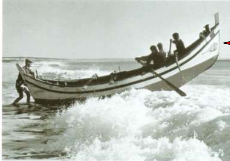
Ilustração 7 – O olho-udjat de uma embarcação da Costa de Caparica