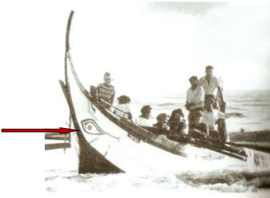
Ilustração 5 – O olho-udjat de uma embarcação da Costa de Caparica