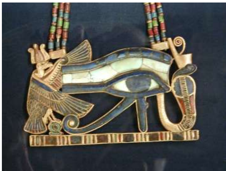
Ilustração 3 - Peitoral do faraó Tutankhamon (XVIII Dinastia): o olho udjat enquadrado e protegido pelas deusas Nekhbet (deusa-abutre do Alto Egípto) e Uadjet (deusa-cobra do Baixo Egípto). Tesouro de Tutankhamon. Museu Egípcio do Cairo.

Em termos concretos, tem uma forma híbrida: a forma geral e a sobrancelha derivam do olho humano, enquanto as linhas desenhadas por baixo correspondem a um olho de falcão (o animal sagrado de Hórus na mitologia egípcia). É representado em estelas e em especial em sarcófagos, no seu interior ou sobre a imagem de uma porta falsa orientada para Oriente. Tornou-se o símbolo para o estado de perfeição. Tornou-se um signo protector por excelência. Como amuleto, o udjat era também colocado nas faixas das múmias ou usado como colar ou num colar.