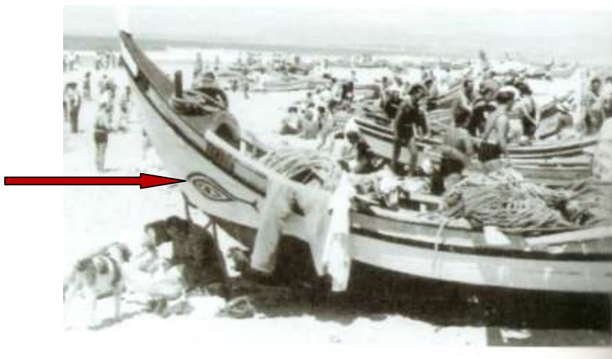
Ilustração 6 – O olho-udjat de uma embarcação da Costa de Caparica