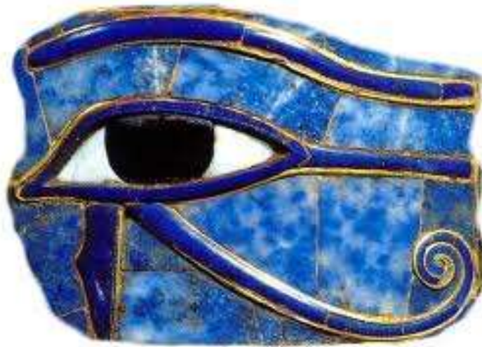
Ilustração 4 - Pormenor do olho esquerdo de Hórus (olho-udjat) de uma bracelete em ouro e lápis-lazúli do faraó Chechank II (XXIV Dinastia). Tânis. Museu Egípcio do Cairo.

Não é de rejeitar que, além dos seus signos próprios (a sítula, o nó de vestuário, etc.), tivesse «trazido» também símbolos associados ao seu filho, neste caso o olho udjat . Verosimilmente, como signo de protecção e de segurança, pode ter sido associado aos marinheiros/ pescadores e à suas embarcações, conhecendo, naturalmente, alguma «evolução» formal, resultante dos «contributos» directos de determinadas comunidades ou práticas.