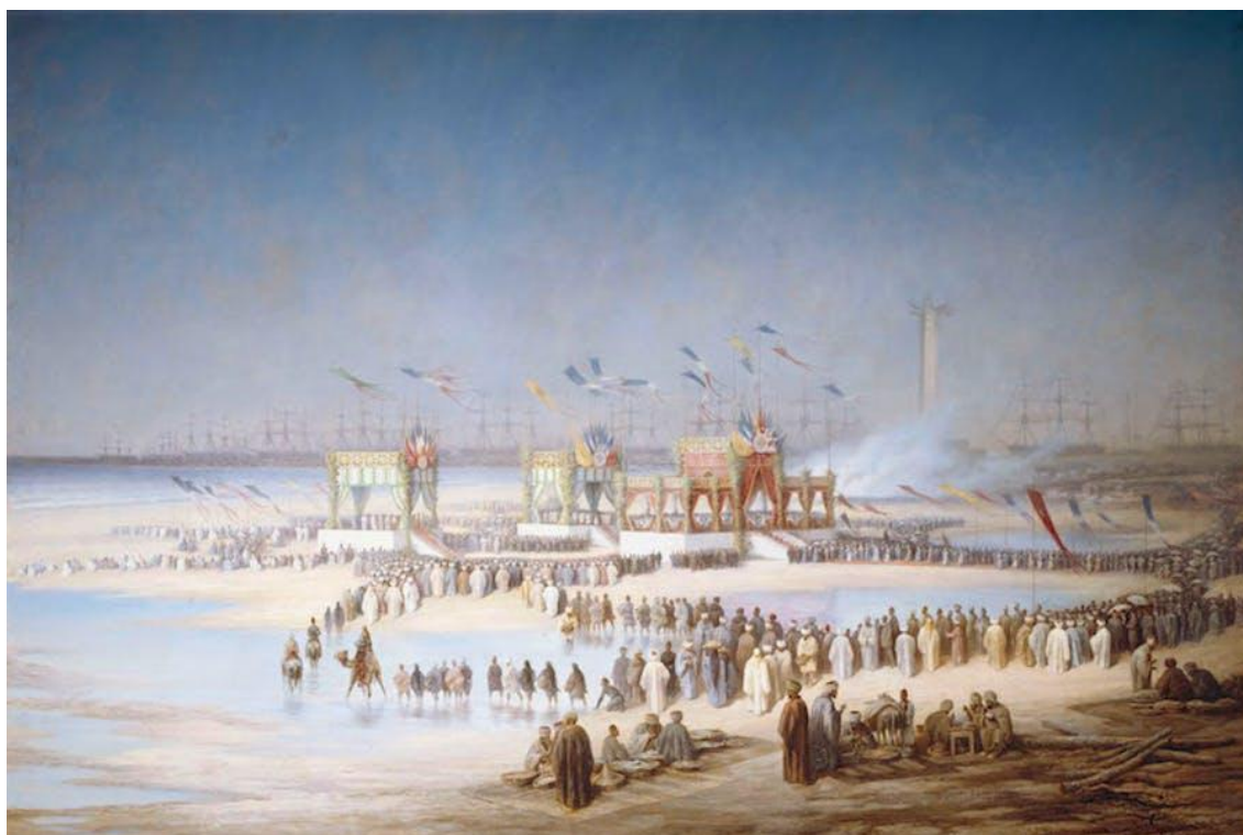
Cérémonie d'inauguration du Canal de Suez à Port-Saïd (17 November 1869), Edouard Riou.